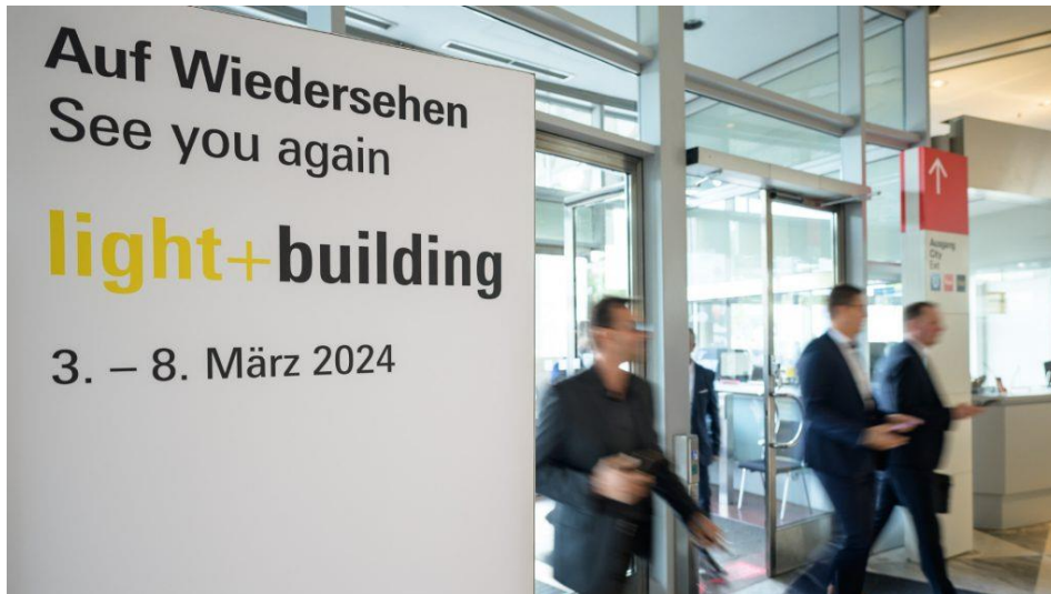
现场观众对于展会效果一致好评，并表示将再次参与2024年 Light + Building。

经历两年半的疫情后，2022年Light + Building 秋季展于10月3至8日再次成功举办。法兰克福展览集团总裁兼首席执行官马赋康先生在总结为期五天的展会时表示：“我们很高兴看到观众对展会仍保持浓厚兴趣，积极探索节能环保等当代能源挑战的解决方案，正如我们一直强调的，面对面交流仍是展会的核心价值，人们之间的交流促成了商贸合作。参展商及观众排除诸多困难后成功参展，这也为我们极好的诠释了当我们面对挑战时，需要以积极及勇于冒险的态度去跨过难关。”